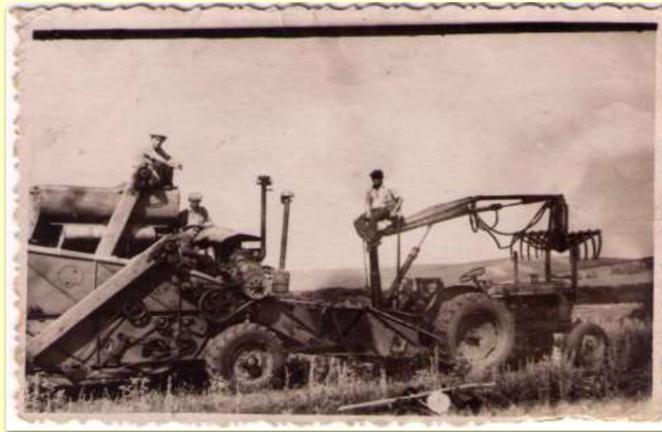
Уборка урожая на отделении «Вперед»,