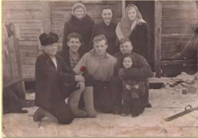
Семья дедушки. Снимок 50-ых годов.