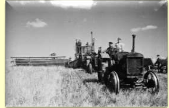
Трактор «СХТЗ 1530»