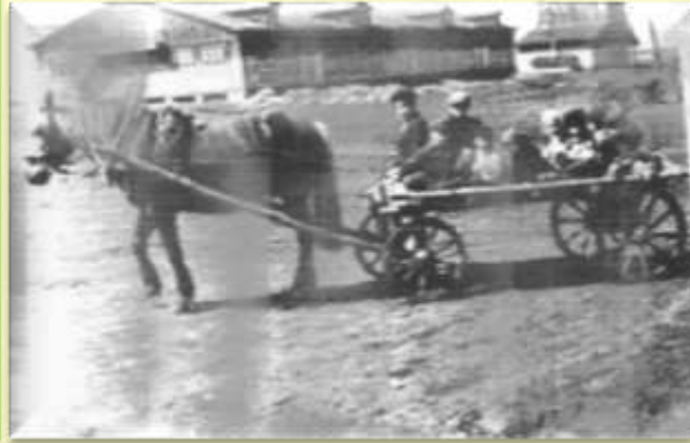
всё возили на быках