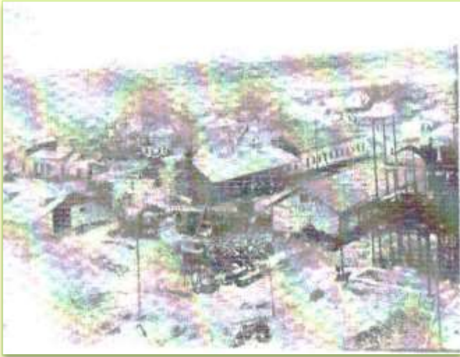
Панорама строящегося п.Магнитный