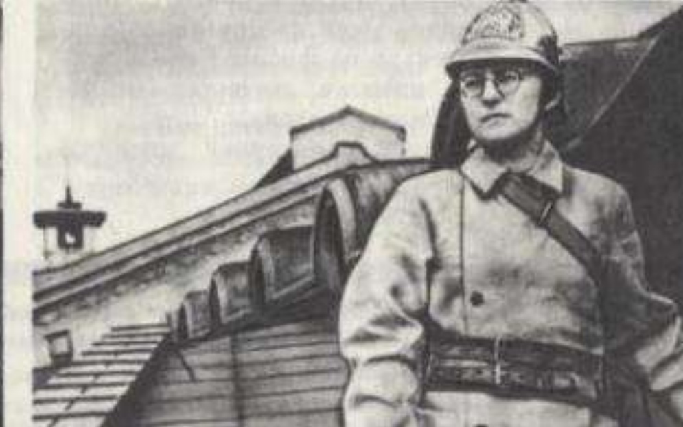
Поэт Н. Тихонов и композитор Д.Шостакович в дни блокады