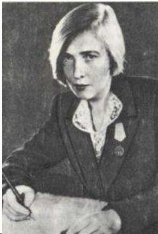
Голос поэта Ольги Берггольц был голосом блокадного Ленинграда