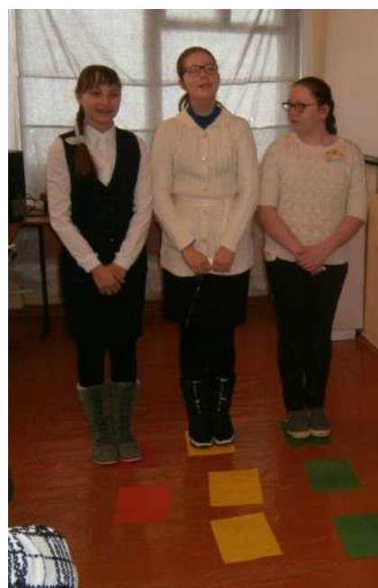
Зеленая, красная и желтая дорожки