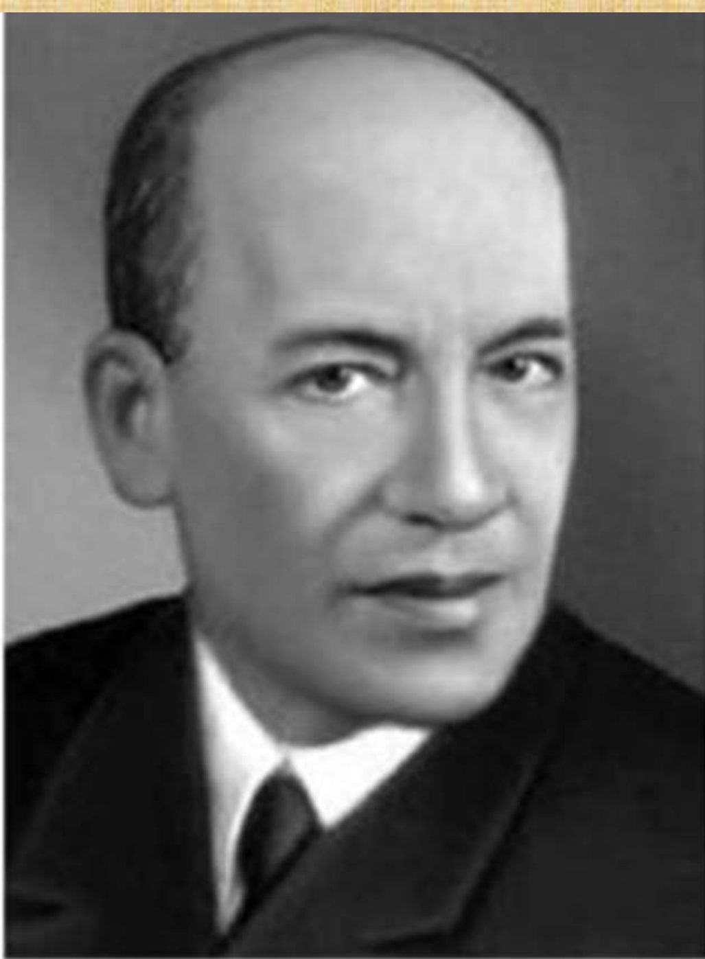
Исаак Осипович Дунаевский